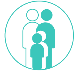
Familier med kræftramte børn

De fire børnekræftafdelinger har FMKB også et godt samarbejde med og der er tilknyttet kontaktpersoner på alle fire afdelinger. Her stiller vi startkit til rådighed. I Skejby og på Rigshospitalet er der opslagstavler med informationer om FMKB.